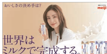
●明治おいしいミルクシリーズ トップボード