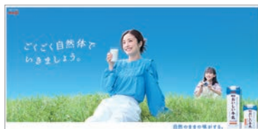
●明治おいしい牛乳 トップボード