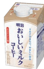
●明治おいしいミルクコーヒービッグパッケージ