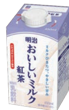
●明治おいしいミルク紅茶ビッグパッケージ