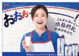
●明治おいしい低脂肪乳 トップボード