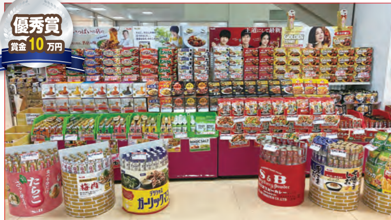
(株)ユニカ ファーマーズマーケット千歳屋様 (東京都)

発売60周年のゴールデンカレーを中心に、12尺のスペースで大量陳列を行った迫力のある売場。さらに、棚の前には張り出し陳列を組み合わせ、フロア仕器も設置することで、最大限と思えるほどのボリューム感のある展開になっています。各種カレー商品をはじめ、パスタソースやスパイスなど多様な多彩な商品を陳列することで、エスピー商品のアピール効果も高い売場です。