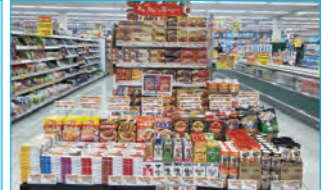
株セブンスター 垣生店様 (愛媛県)