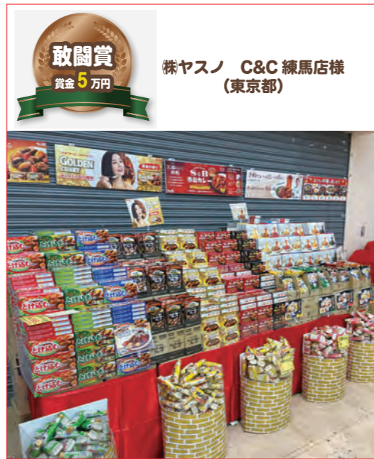
株ヤスノ C&C 練馬店様 (東京都)