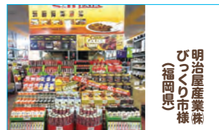
明治産業株 びつくり市株 (福岡県)