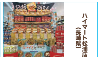
ハイマート松浦店様 (長崎県)