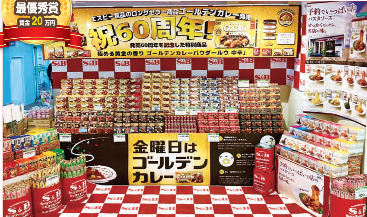
(株)ホクノー 中央店様 (北海道)

ゴールデンカレー発売60周年をテーマに売場づくりを実施。中央にゴールデンカレー丸ウを はじめ、新製品のゴールデンカレーパウダー丸ウなどを陳列し、両サイドには予約でいっぱい の店のパスタや香辛料チューブなども配し、全体でエスピー食品の商品力を発信する売場展開 になっています。ロングセラーのゴールデンカレーを打ち出した訴求力が魅力です。