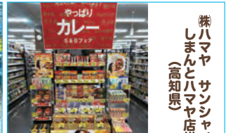
株ハマヤ サンシャイン (高知県)