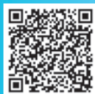
応募用二次元コード