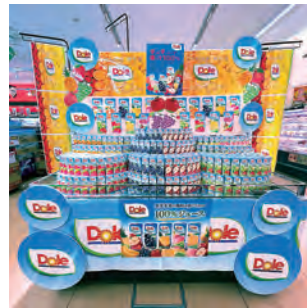
ボリュームコース グランプリ 株式会社ウジェスーパー 中里店様