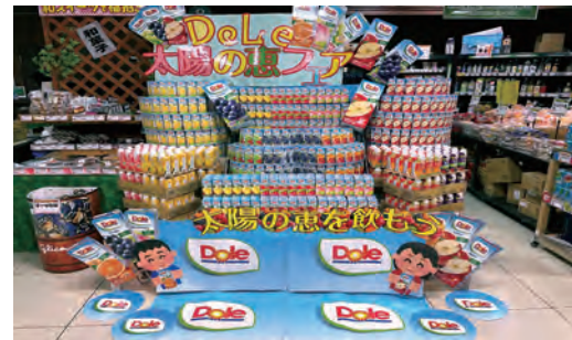
アイデアコース グランプリ 株式会社ビック・ライズ 食品館あおば六角橋店様