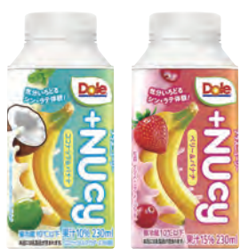
ココナッツ&バナナ ベリー&バナナ