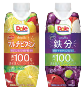
1日分のマルチビタミン 1日分の鉄分