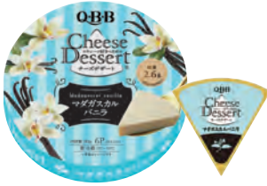
チーズデザート6P マダガスカルバニラ