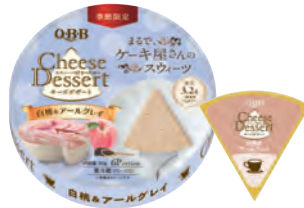
チーズデザート6P 白桃&アールグレイ