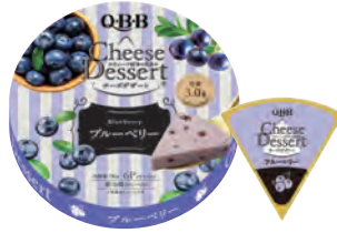
チーズデザート6P ブルーベリー