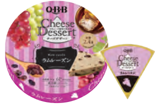
チーズデザート6P ラムレーズン