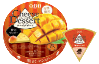
チーズデザート6P 賀沢マンゴー