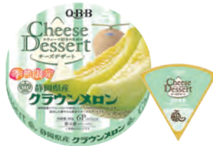
チーズデザート6P 静岡県産クラウンメロン