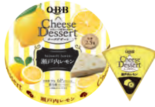
チーズデザート6P 瀬戸内レモン