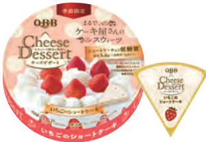
チーズデザート6P いちごのショートケーキ