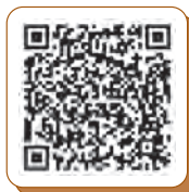
応募用二次元コード