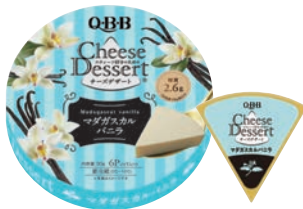
チーズデザート6P マダガスカルバニラ