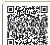
応募用二次元コード

2.空メールをお送りいただいたメールアドレス宛に、応募専用WEBサイトのURLと個別のID・パスワードを送付いたします。 3.URLにアクセスし、必要事項をご入力いただき、ご応募ください。