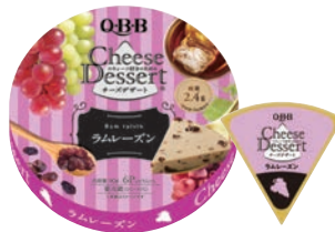
チーズデザート6P ラムレーズン