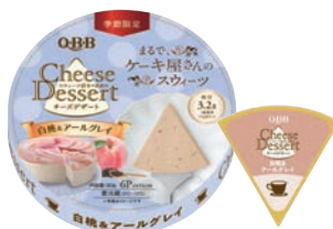
チーズデザート6P 白桃&アールグレイ