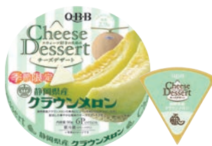
チーズデザート6P 静岡県産クラウンメロン