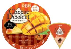
チーズデザート6P 賛沢マンゴー