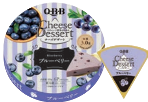
チーズデザート6P ブルーベリー