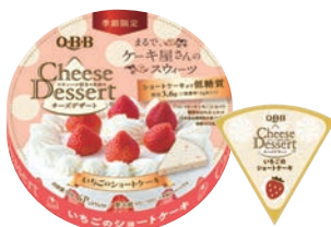
チーズデザート6P いちごのショートケーキ