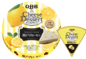
チーズデザート6P 瀬戸内レモン