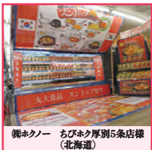
(株)ホクノー ちびホク厚別5条店様(北海道)