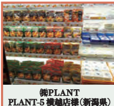
(株)PLANT PLANT-5 横越店様(新潟県)