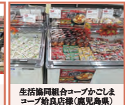
生活協同組合コープかごしま ユーブ始良店様(鹿児島県)