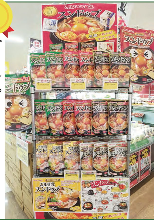
(株)ウジエスパー 古川バイパス店様(宮城県)