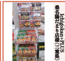
桑名福だまの店様(三重県)