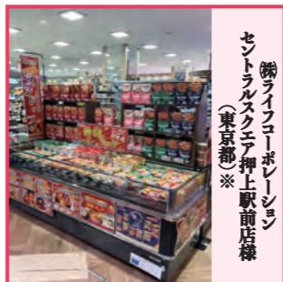
セントリーフコーポレーション(東京都)