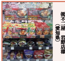
(株)不屋 岩井店様(愛知県)