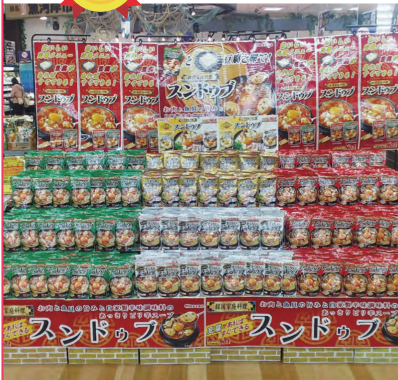
(株)文化堂 ウィラ大井店様(東京都)