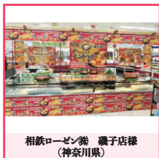
相鉄ローゼン(株) 磯子店様(神奈川県)