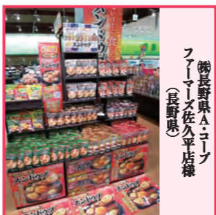
長野県A・コープ ファーマーズ佐久平店様(長野県)