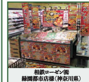
相鉄ローゼン(株) 緑園都市店様(神奈川県)