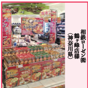
相鉄ローゼン(株) 鶴ヶ峰店様(神奈川県)