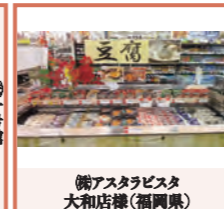
(株)アスタラピスタ 大和店様(福岡県)