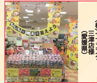
(株)セブンスター 三津店様 (愛媛県)