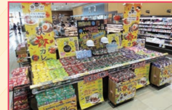
(株)長野県A・コープ ファーマーズ南長野店様(長野県)