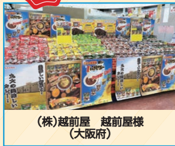
(株)越前屋 越前屋様 (大阪府)