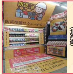
(株)ホクノー ちびホク厚別5条店様 (北海道)