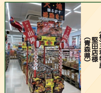
(株)三和物産 堅田店様 (青森県)