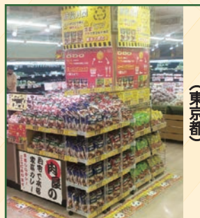
(株)ビソフラインズ 食品館あおば深川店様 (東京都)