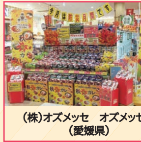
(株)オズメッセ オズメッセ様 (愛媛県)