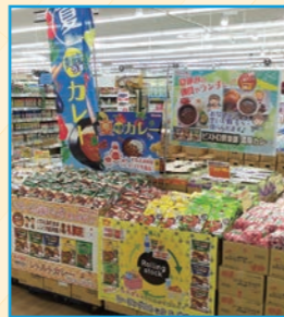
(株)マルイチ 財光寺店様 (宮崎県)