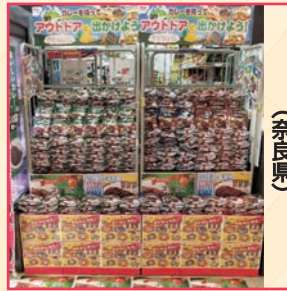
(株)ローア ミナラ店様 (奈良県)