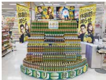
ラルズ スーパーアークス星置店様