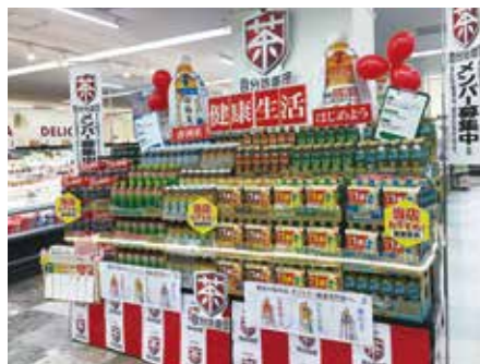
東光ストア 東光ストア平岡店様