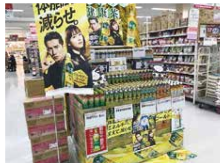
ラルズ ビッグハウス花川店様