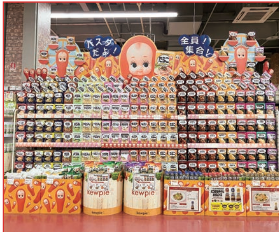
株 PLANT PLANT 3 津幡店様