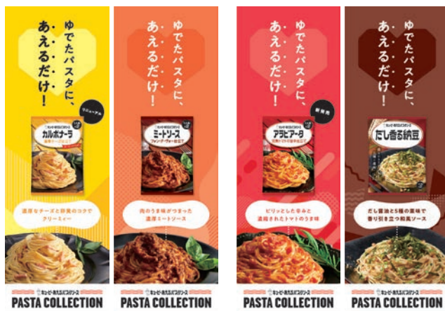
のぼり ※表裏異種柄 2枚1セット (W300×H900mm)