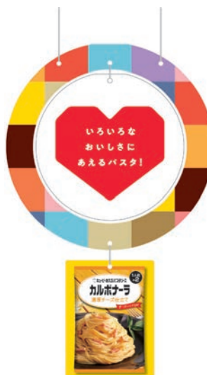
天吊りPOP ※2個1セット (上リース 直径450mm 下PKG W150×H200mm)