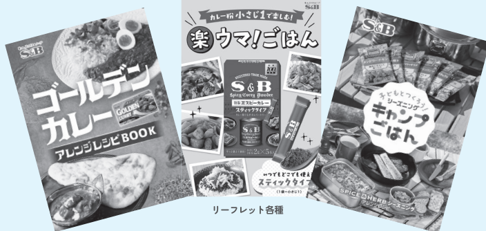
リーフレット各種