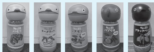
スパイスビニールマスコット (バセリ、ターメリック、シナモン、パプリカ、ブラックペッパー)