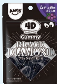
Amos 4Dグミ ブラックダイヤモンド