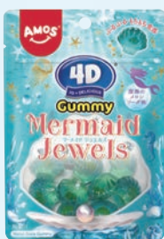
Amos 4Dグミ マーメイドジュエルズ