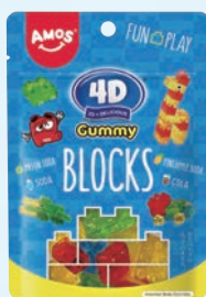
Amos 4Dグミ ブロックス