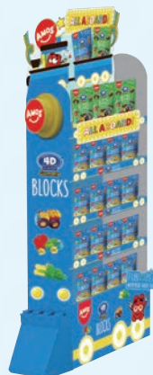
●Floor display (670×200×1700mm)