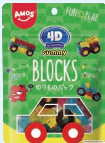
Amos 4Dグミ ブロックスのりものパック