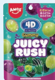
Amos 4Dグミ ジューシーラッシュグレープ