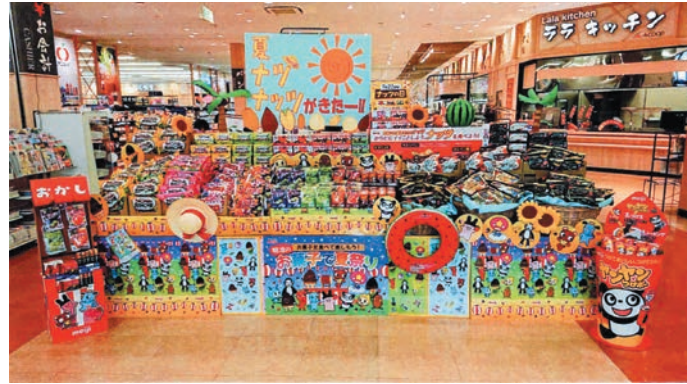
Aコープ ララベル店 様 (佐賀県) ※昨年実施例