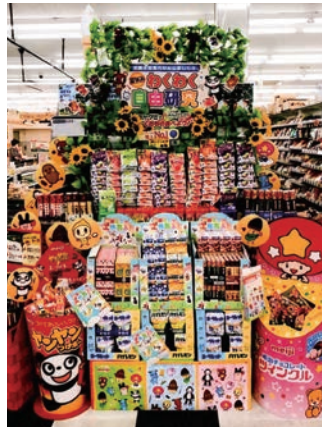
フードマーケットマム 藤枝店 様 (静岡県) ※昨年実施例