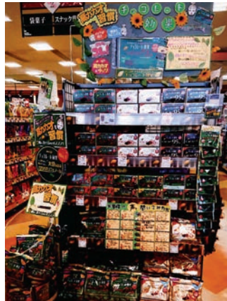
フーズマーケットホック 塩田店 様 (沖縄県) ※昨年実施例