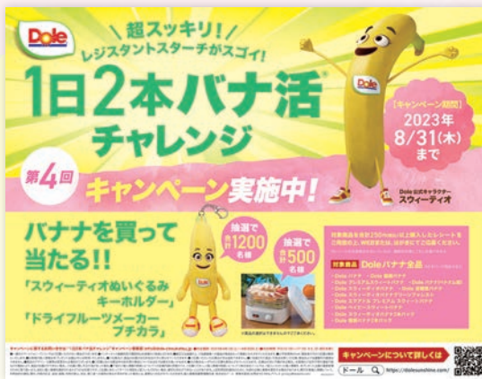
第四回バナ活キャンペーン告知