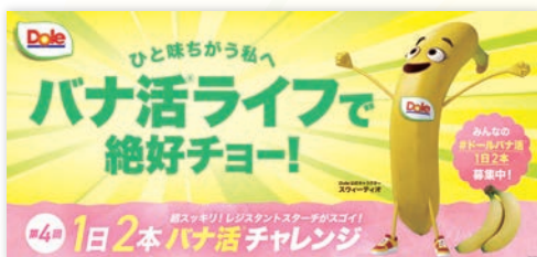
第四回バナ活キャンペーン ミニTOPボード (600×280mm)