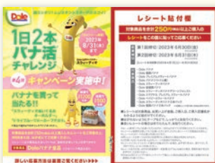
第四回バナ活キャンペーン 応募ハガキ