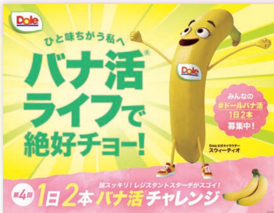
第四回バナ活キャンペーン