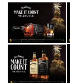
1フェイスPOP(W78×H226mm) ※JDボトル1本分幅サイズ