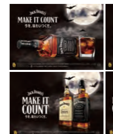
1フェイスPOP(W78×H226mm) ※JDボトル1本分幅サイズ