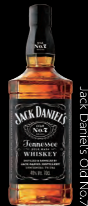
Jack Daniel's Old No.7