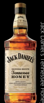
Jack Daniel's Tennessee Honey