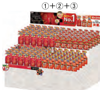
シリーズ展開(イメージ)