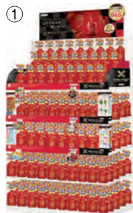
ゴンドラ展開(イメージ)