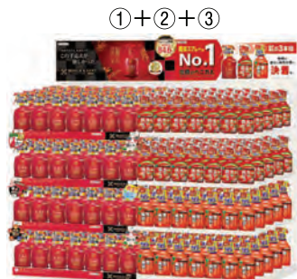
シリーズ展開(イメージ)