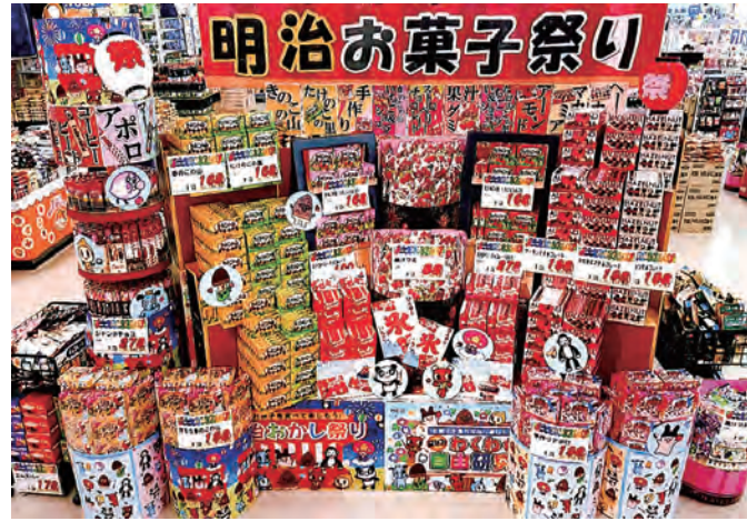
スーパー スーパーマーケットサンエー様 (岩手県) ※昨年実施例