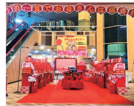
JALまね 島根県農業協同組合 ラビタ本店 様