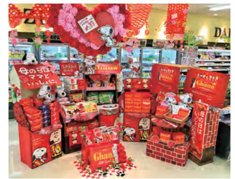
株Aコープ西日本 Aコープラポ店 様