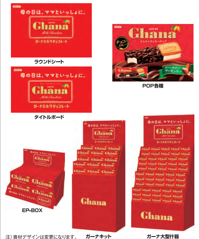
注) 資材デザインは変更になります。