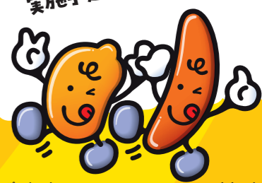
びーなっち たねっち