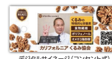
デジタルサイネージ(コンセント式) 4.3インチ W78×H190×D10(mm) 7インチ W183×H100×D16(mm)

動画内容: くるみ収穫・生産風景、くるみ・腸活専門家コメント、腸活レシピ紹介(音声・字幕込・約3分) ※サイズに合わせた専用カバー付き