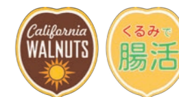
コーナー POP 展開 300×200mm H120mm(表・裏)

動画内容: くるみ収穫・生産風景、くるみ・腸活専門家コメント、腸活レシピ紹介(音声・字幕込・約3分) ※サイズに合わせた専用カバー付き