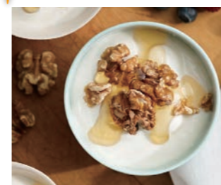
くるみとはちみつのギリシヤヨーグルト