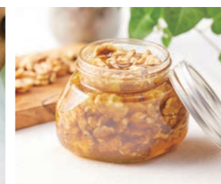
くるみのはちみつ漬け