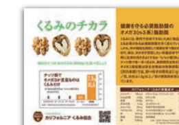
くるみのオメガ3脂肪酸リーフレット W105×H147(mm) 両面