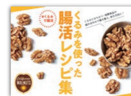
くるみで腸活レシピリーフレット W97×H80(mm) 蛇腹折り・両面、展開サイズW485×H80(mm)