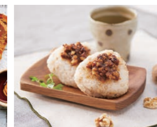
くるみ味噌-焼きおにぎり