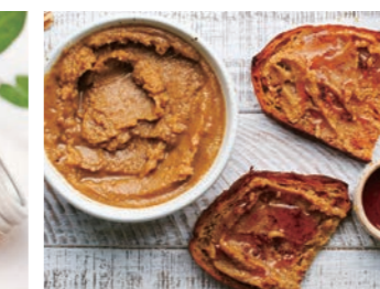
くるみはちみつバター