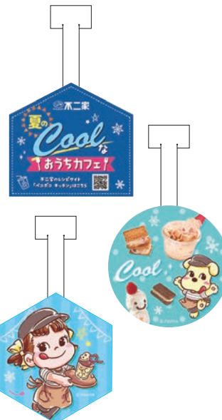
スイングPOP (約 W130×H200mm/ 枚)