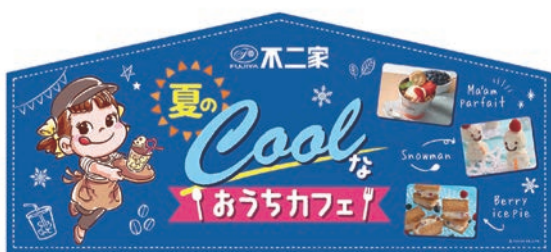
トップボード 表・裏 (W900×H400mm)