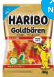
ハリボー ゴールドベア80g