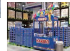
韓国のハリボー 100周年売り場