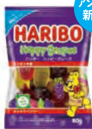
ハリボー ハッピーグレープ80g