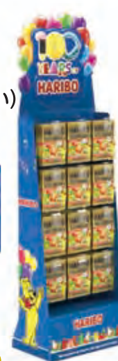
100周年ポール (H175×W156×D65cm /プラスチック製)