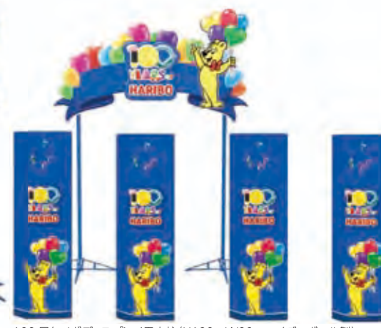
100周年メガディスプレイ用支柱(H120×W20cm /ダンボール製)

*販促ツールにしましては、三菱食品株式会社 営業担当者にお問い合わせください。 *販促ツールのデザイン・仕様等は、変更になる場合がございますのでご了承ください。