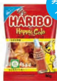
ハリボー ハッピーコーラ80g