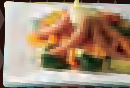
【シャウフォンデュ】