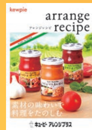
アレンジプラスタブロイド (257×182mm)