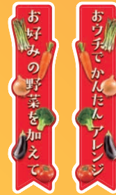
お好みの野菜を加えてかんたんアレンジ仕切りPOP (430×100mm)