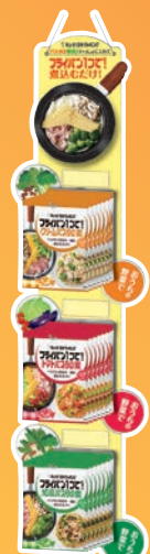
フライパン1つで!ハンガー仕切りPOP (150×25×930mm)