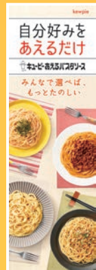
あえるバラエティーポスター (のぼり風紙製、900×300mm)