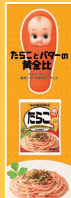
たらこキューピーポスター (のぼり風紙製、900×300mm)