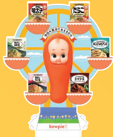
あえる観覧車型パネル (900×300mm)