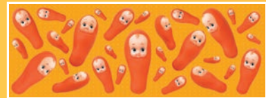
たらこキューピー裾巻き (1200×430mm)