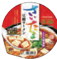
さいたま豆腐ラーメン