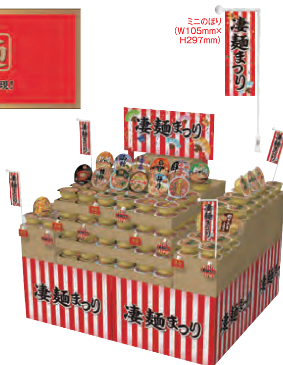
ミニのぼり (W105mm× H297mm)