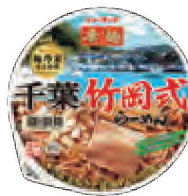
千葉竹岡式らーめん