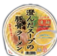
澄んだスープの豚骨ラーメン