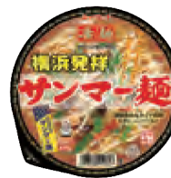
横浜発祥サンマー麺