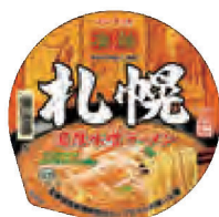
札幌濃厚味噌ラーメン