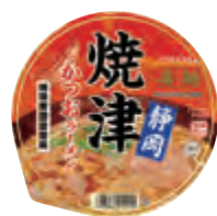
静岡焼津かつおラーメン