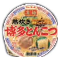
熱炊き博多とんこつ