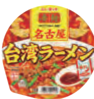
名古屋台湾ラーメン