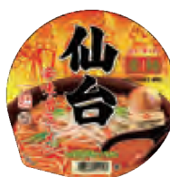
仙台辛味噌ラーメン