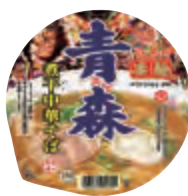
青森煮干中華そば