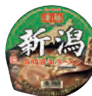
新潟背脂醤油ラーメン