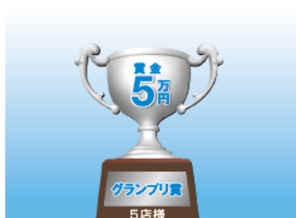
副賞 写真付き表彰状