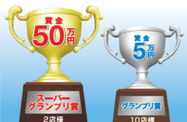
副賞 写真付き表彰状