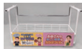
●冷蔵ショーケース前ワイヤー什器