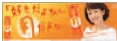
エンドパネル(縦30cm×横90cm)