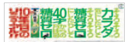
エンドパネル(縦30cm×横90cm)

飲酒は20歳になってから。お酒はおいしく適量を。妊娠中や授乳期の飲酒は、胎児・乳児の発育に悪影響を与える恐れがあります。飲酒運転は絶対にやめましょう。